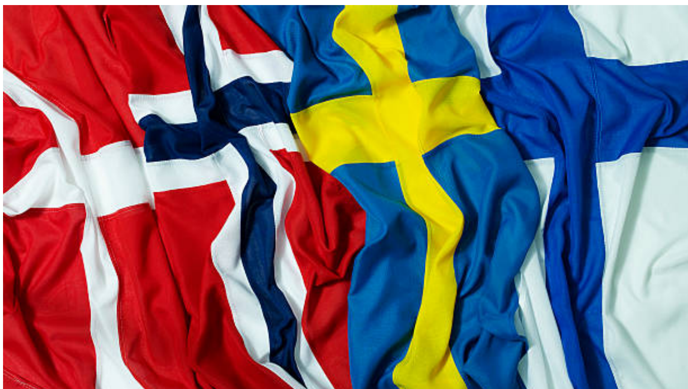
Flags, Danish, Norwegian, Swedish and Finland

Berikutnya ialah Rosetta Stone. Aplikasi belajar bahasa asing satu ini penulis rekomendasikan untuk kamu yang ingin melatih kemampuan speaking guys . Hal ini karena