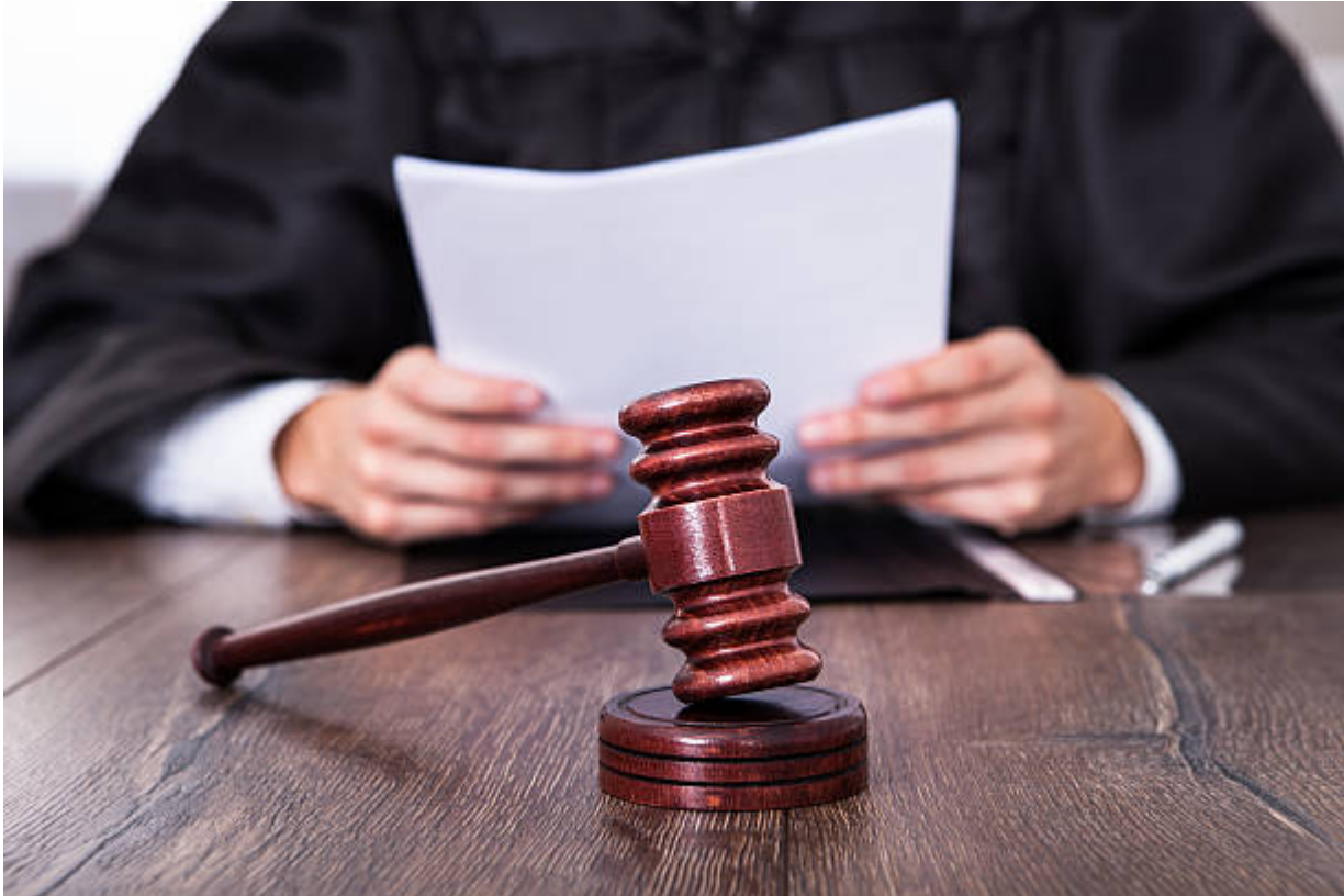
Close-up Of Male Judge In Front Of Mallet Holding Documents

Next , mata kuliah peminatan di jurusan hukum berikutnya ialah hukum tata negara. Kalau konsentrasi ini lebih berfokus lagi mengenai lembaga dalam sebuah negara. Di SMA kamu kenal dong istilah trias politika ?