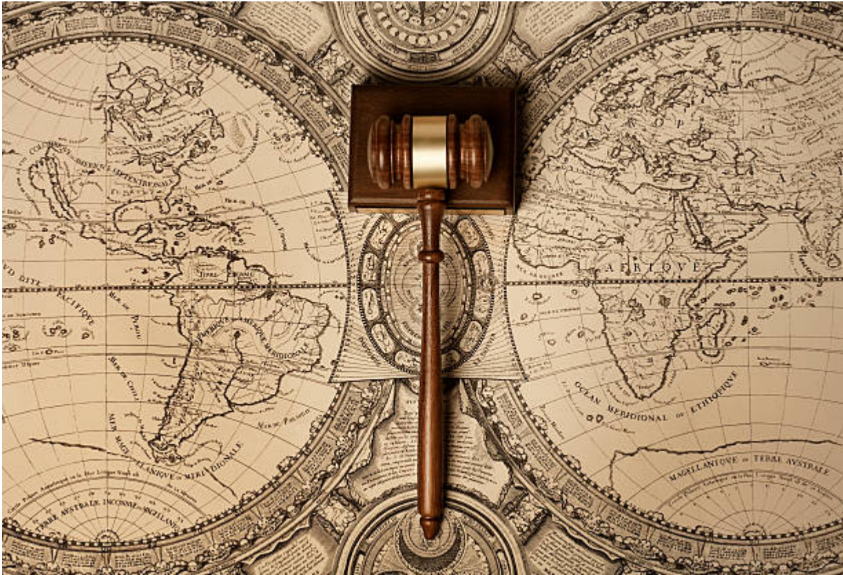
Gavel of justice on old world map

Sampailah kita di akhir mata kuliah peminatan di jurusan hukum, yakni hukum internasional. Beberapa pelajar seringkali salah kaprah dan menyamakan mata kuliah hukum internasional dengan jurusan hubungan internasional .