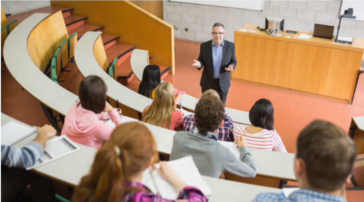
Elegant teacher with students sitting at the college lecture hall

Berikutnya ada faktor mengenai metode pengajaran. Yap , salah satu perbedaan universitas negeri dan swasta terdapat di dalam metode pengajarannya guys . Pada semester pertama pembelajaran di PTS, umumnya kamu akan langsung mendapatkan materi yang menjurus pada bidang ilmu tertentu.